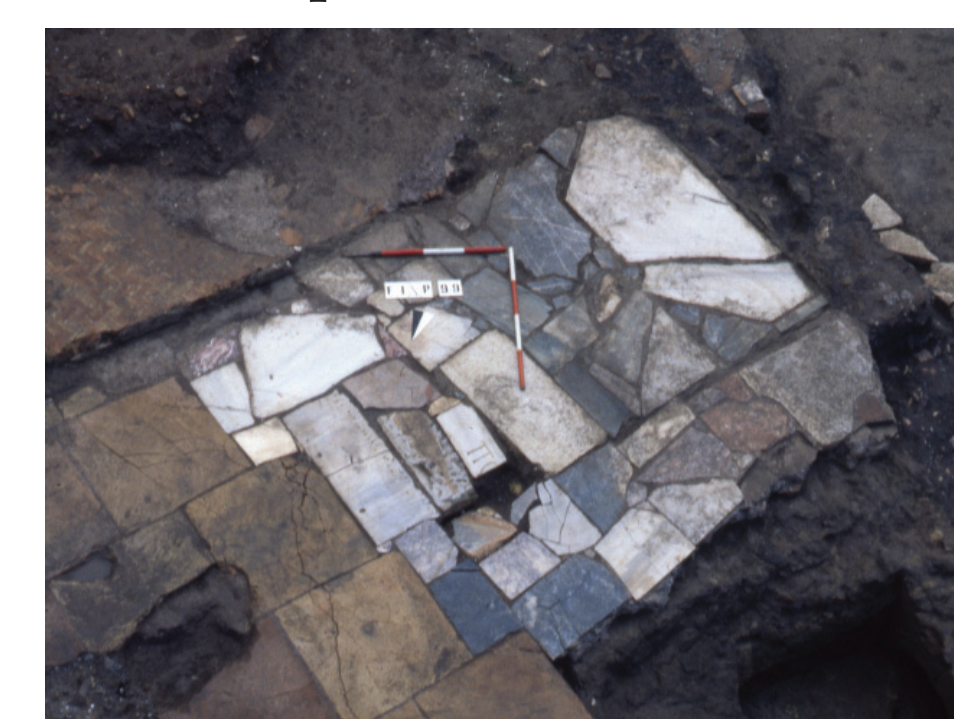
Fig. 9 - Restauro antico dell'area scoperta con marmi di reimpiego (ARCHIVIO SOVRINTENDENZA BB.CC. - ROMA CAPITALE)