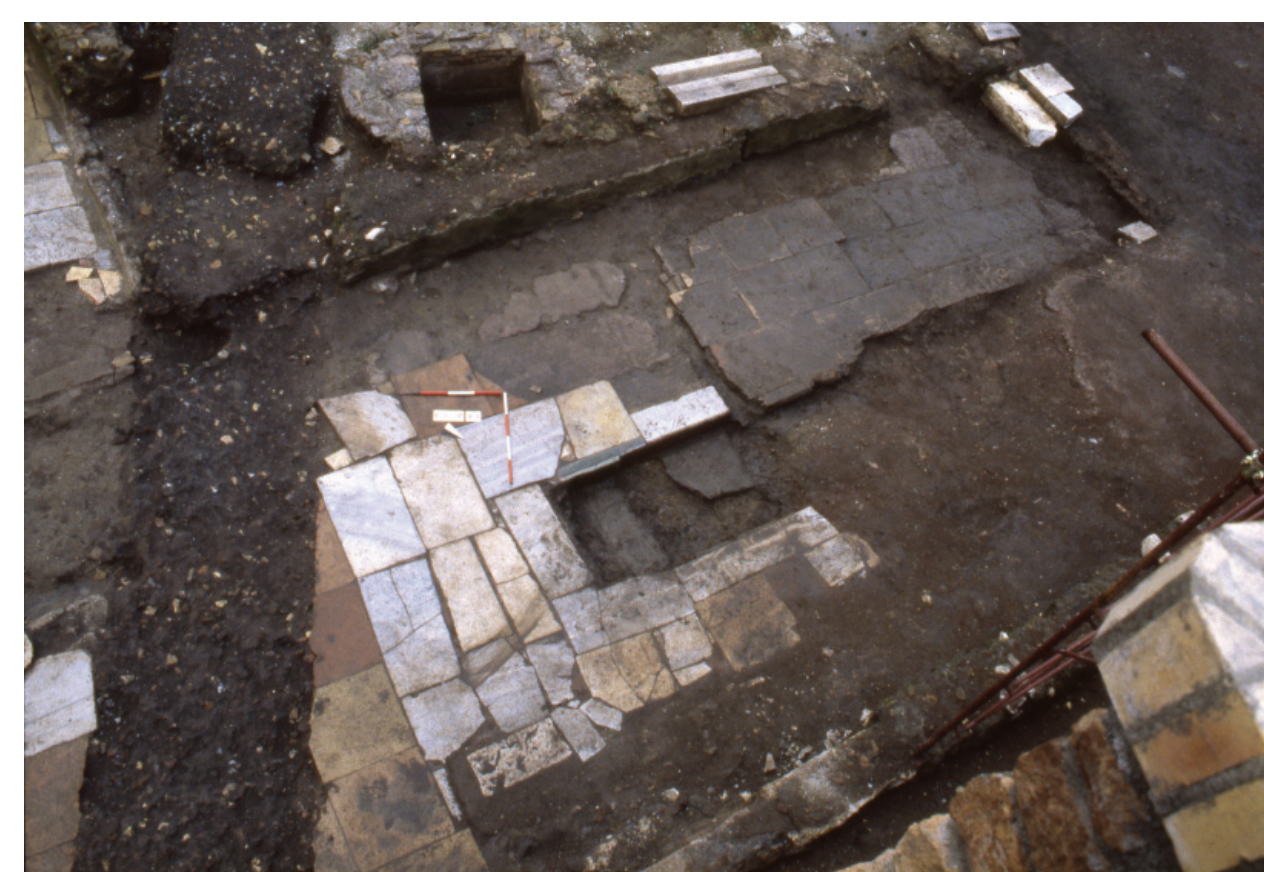
Fig. 4 - Area scoperta con vasca (ARCHIVIO SOVRINTENDENZA BB.CC. - ROMA CAPITALE)

Tutte queste strutture sono realizzate con tecniche edilizie di modesto livello qualitativo, eseguite con materiale di recupero, in alcuni casi proveniente con certezza dallo stesso Templum Pacis , ormai evidentemente in fase di destrutturazione. I tramezzi che suddividono gli ambienti sono a volte realizzati con semplici murature a secco, le pavimentazioni, nei pochi casi in cui sono conservate, sono in bipedali o in coccio pesto, mentre le soglie riutilizzano costantemente elementi marmorei di grandi dimensioni (fig. 7).