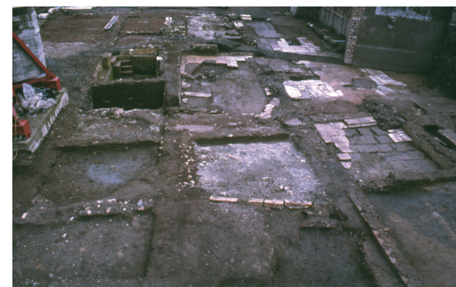
Fig. 3 - Veduta d'insieme delle strutture tardoantiche

ti che, riutilizzando le fondazioni degli euripi, assumono una forma rettangolare, in alcuni casi divisi al loro interno in due o tre parti da tramezzi spesso obliqui rispetto ai perimetrali (fig. 5). Sul lato orientale dell'area aperta vi è un piccolo ambiente con una vasca divisa in due bacini: il suo sistema di adduzione utilizza sia le acque meteoriche, tramite un discendente inserito nel muro, sia una fistula, probabilmente collegata con l'impianto originario di alimentazione degli euripi (fig. 6). Il complesso prosegue oltre il limite di scavo, sotto via dei Fori Imperiali, mentre sul lato meridionale l'abbassamento del livello di calpestio, avvenuto in epoca successiva, non ne ha permesso la conservazione, compromettendo la possibilità di ricostruirne la planimetria complessiva.