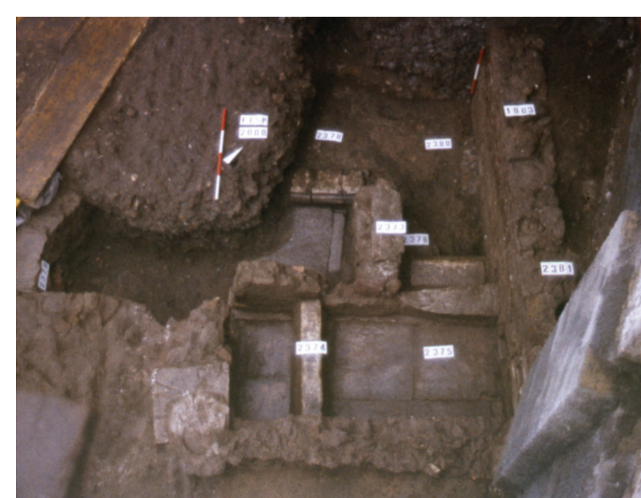
Fig. 6 - Ambiente 11; visibile il sistema di vasche

L'intero complesso nel corso del VI secolo venne abbandonato e rasato in alcuni casi fin sotto il livello di spiccato.