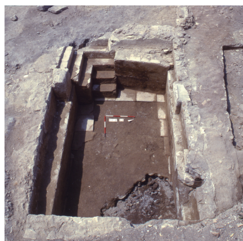
Fig. 8 - Ambiente ipogeo 3