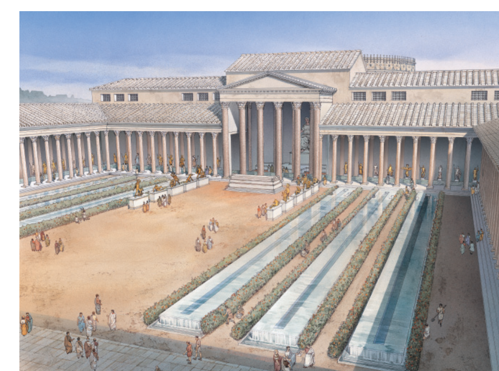
Fig. 1 - Ricostruzione del Foro della Pace in età antica (disegno Inlink)

Il Templum Pacis o Foro della Pace costituisce, come è noto, una delle cinque piazze monumentali dei Fori Imperiali. Voluto da Vespasiano per celebrare la pacificazione della Giudea e dell'Oriente, fu ultimato nel 75 d.C. I recenti scavi del 1998-2000, effettuati dalla Sovrintendenza ai Beni Culturali del Comune di Roma, hanno permesso di ricostruirne la planimetria. La grande piazza pavimentata di terra battuta - solo una larga fascia lungo il lato settentrionale era ricoperta di lastre di marmo lunense - era circondata su tre lati da portici, mentre il lato a nord recava un colonnato aggettante. La zona non lastricata era occupata da lunghe strutture parallele, tre per ogni lato, interpretabili come canali o euripi e costituiti da bassi podi ricoperti da un velo d'acqua. Sul lato meridionale si trovava il tempio vero e proprio, con la colossale statua di culto (fig. 1).