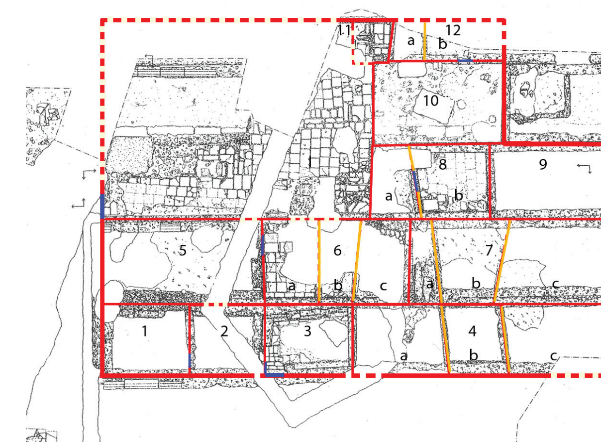
Fig. 5 - Ricostruzione dell'assetto planimetrico degli ambienti tardoantichi. In rosso muri perimetrali degli ambienti; in giallo tramezzi interni; in azzurro soglied'ingressi.

Altre strutture attribuibili alla stessa fase sono state individuate anche sul portico occidentale e nella parte meridionale del Foro, ma lo stato di conservazione e la mancanza di continuità topografica, non permette di attribuirle allo stesso complesso, anche se costituiscono un'ulteriore conferma della demonumentalizzazione del Templum Pacis .