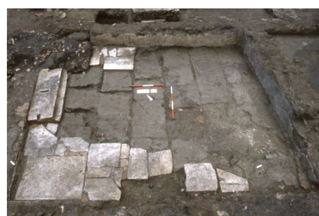
Fig. 7 - Ambiente 8b pavimentato in bipedali; visibile la soglia di marmo